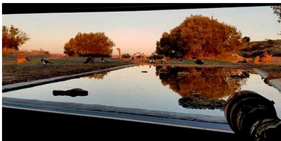
Utsikt från gömslet vid drickspoolen för rovfågel

I anslutning till stäppen och de lägre bergen runt Montsonís finns en lång rad fågelarter möjliga att fotografera från olika specialgömslen. Gömslena är anpassade för upp till 3 fotografer/gömsle. Här kommer vi att dela upp oss med några deltagare per gömsle och köra en sittning på morgonen och en på eftermiddagen varje dag. Sedan roterar vi mellan de olika gömslena.