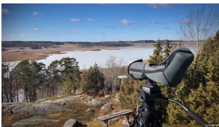
Fantastisk vy över Hjälstaviken