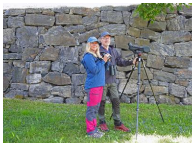
Vi syns kanske snart i fält igen?