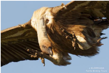
Jag ser dig!

Många tycker att det är svårt med de olika lätena och med sången hos våra olika fågelarter. Många tycker nog att det är lite jobbigt med alla typer av läten, det är sång, skuggsång, lockläten, varningsläten osv, och som det inte vore nog med det så kan vissa arter härma andra arter! Men nu kan vi erbjuda dig lite hjälp på treven, under vår/sommaren kommer vi att hålla kurser i just fågelläten. Första tillfället blir 26 maj 2020, kommer snart mer information på vår hemsida.