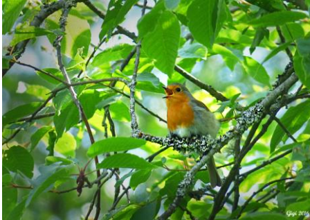
Härlig fågelsång – Rödhake!!

Det finns en hel del frågor kring den rådande situationen i Europa och resten av världen. Vi vill att ni som resenärer hela tiden ska känna er trygga och säkra på våra resor. Därför följer vi noggrant de rekommendationer som svenska myndigheter kommer ut med. I de fall som UD eller folkhälsomyndigheten avråder oss att resa till vissa områden eller länder så kommer vi naturligtvis följa detta och ställa in resan. Skulle detta hända så kommer vi att betala tillbaka de avgifter som ni betalat till oss. Er säkerhet och hälsa är A och O för oss. Du kan läsa mer om våra villkor här .