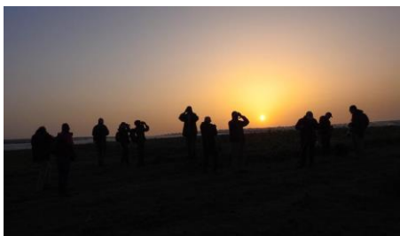
Underbar solnedgång på en av våra resor!

Det är lätt att lyfta blicken och titta långt bort i världen, men Fågelguidning AB kommer att öka antalet kortare aktiviteter i Sverige. Detta känns bra med tanke på miljön och för dig som inte vill lägga hela veckor på resor. Vi kommer att komplettera listan med guidningar, kurser och utbildningar fortlopande, så vill du ha den senaste informationen så titta in på vår hemsida eller Facebook lite då och då.