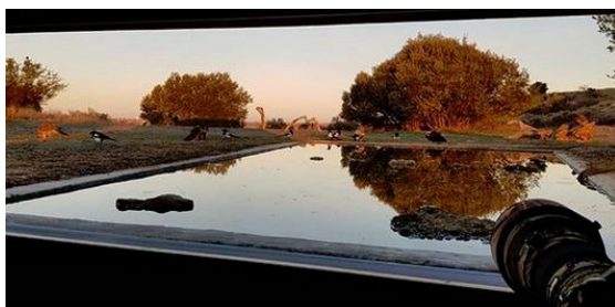
Utsikt från gömslet vid drickspoolen för rovfågel

I anslutning till stäppen och de lägre bergen runt Montsonís finns en lång rad fågelarter möjliga att fotografera från olika specialgömslen. Gömslena är anpassade för upp till 3 fotografer/gömsle. Här kommer vi att dela upp oss med några deltagare per gömsle och köra en sittning på morgonen och en på eftermiddagen varje dag. Sedan roterar vi mellan de olika gömslena.