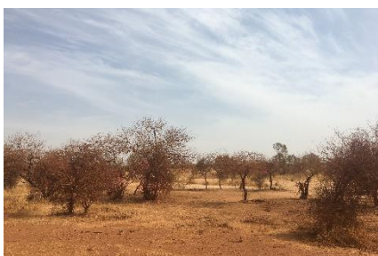
Landskabet bliver mere tørt ...

Heldigvis var der også fugle at se undervejs. Northern Ant-eater Chat, mindst 50 Abyssinian Roller (formodentlig mange flere) og ikke mindst Abyssinian Ground Hornbill viste sig langs vejen. Chestnut-bellied Sandgrouse og Black-crowned Sparrow Lark blev også set af nogle få. Heldigvis skulle de næste dage bringe flere af begge disse arter.