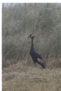
Black Crowned Crane

Efter frokost/lunch kørte vi igen ud i det tørre landskab for at gøre endnu et forsøg på at finde Arabian Bustard. Igen ledte vi længe forgæves og håbet var ved at være slukket, da vores park-guide bad Issa stoppe bussen, mens han hurtigt fik kikkerten for øjnene. Vi fornemmede at han havde fat i noget, og ganske rigtigt havde han fået øje på fuglen. Ud af bussen, op med teleskoperne og så kunne vi ellers nyde synet af en Arabian Bustard som roligt spankulerede omkring på 150 - 200 meters afstand. Også her blev tålmodighed belønnet og vi kunne glade begive os videre mod vores sidste hotel i Saint Louis.