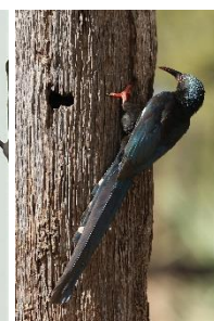
Green Wood Hoopoe

Dagens fugl: Red-necked Falcon som vi så på nært hold mens den parterede et bytte.