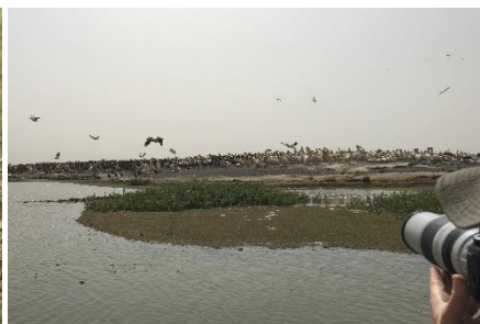
Great White Pelican. 4000 par yngler her.