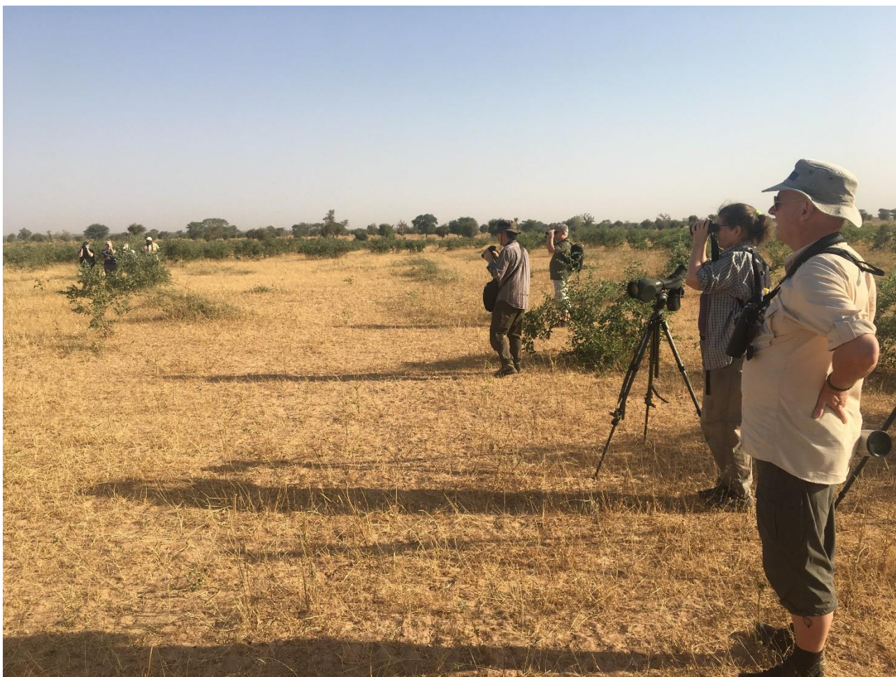
I en halv time nød vi Quail-plover på nært hold.

Vi vil gerne benytte lejligheden til at takke for jeres positive deltagelse, aldrig svigtende gode humør og den måde I hver især bidrog til at gøre denne rejse til noget helt specielt.