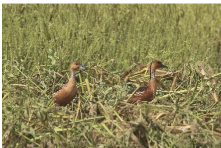
Fulvous Whistling Duck