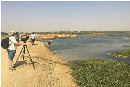
Les Trois Marigots med byggerod