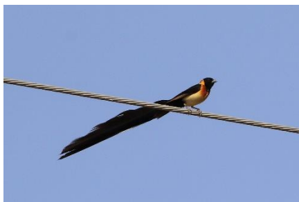
Sahel Paradise Whydah