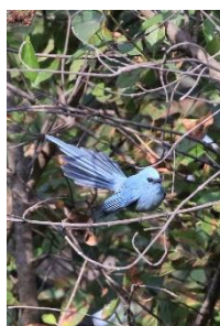
Afr. Blue Flycatcher

Om eftermiddagen birdede vi til fods i bushen langs med floden. Øverst på ønskelisten stod Orange-cheeked Waxbill og Helmeted Guineafowl. Begge blev set godt, Orange-cheeked Waxbill så vi fint i en blandet flok med Black-rumped Waxbill og Helmeted Guineafowl løb på stien foran os flere gange. Cardinal Woodpecker og Spur-winged Goose kom også på listen her.