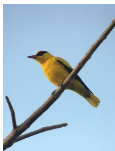
African Golden Oriole

På hotellet fandt Ivan nogle Swallow-tailed Bee-eater som det desværre kun var nogle få der fik set.