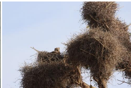
Verreaux's Eagle Owl (Reder af White-billed Buffalo Weaver)