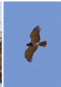
Beaudouin's Snake Eagle

Dagens fugl: Den imponerende Martial Eagle som vi så siddende ved et vandhul hvorefter den lettede og satte sig i et træ.