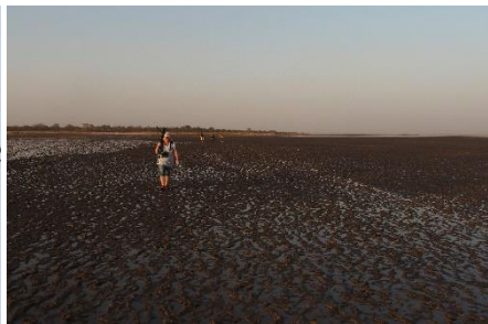
Vi måtte gå gennem lidt mudder ...