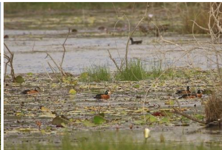
African Pygmy Goose