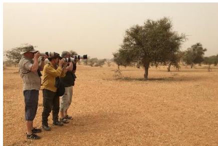
I det tørre landskab fotograferer vi ...