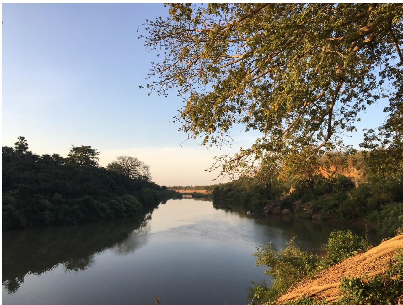
Gambia-floden ved Campement de Wassadou