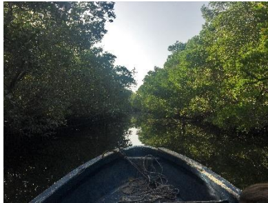
Vi sejler i mangroven