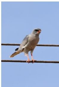
Dark Chanting Goshawk

svirrende vinger, som en musende Tårnfalk, mens lyset fra lygterne fik den til at skinne gyldent. Her levede den virkelig op til sit navn, et næsten magisk øjeblik. Dagens andet target var i hus på bedste vis.