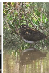
Greater Painted Snipe

Efter frokost/lunch kørte vi igen ud i det tørre landskab for at gøre endnu et forsøg på at finde Arabian Bustard. Igen ledte vi længe forgæves og håbet var ved at være slukket, da vores park-guide bad Issa stoppe bussen, mens han hurtigt fik kikkerten for øjnene. Vi fornemmede at han havde fat i noget, og ganske rigtigt havde han fået øje på fuglen. Ud af bussen, op med teleskoperne og så kunne vi ellers nyde synet af en Arabian Bustard som roligt spankulerede omkring på 150 - 200 meters afstand. Også her blev tålmodighed belønnet og vi kunne glade begive os videre mod vores sidste hotel i Saint Louis.