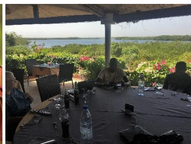
Vores hotel ligger lige ved mangroven