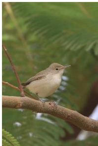
Western Olivaceous Warbler

Sidst på eftermiddagen kørte de fleste af os igen ud til Les Trois Marigots. Vi havde dårligt nået søen før to Fulvous Whistling Duck kom flyvende og landede tæt på. Da vi gik ud på dæmningen varede det heller ikke længe før African Pygmy Goose var spottet. 10 stk af denne lille delikate fugl lå på vandet, de fleste af dem parvis. Turens sidste ønskeart var således i bogen og vi kørte tilbage til hotellet og vores sidste middag sammen.