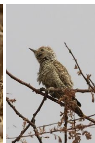
Little Grey Woodpecker