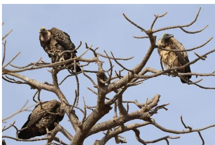
Rüppell's Vulture White-backed Vulture