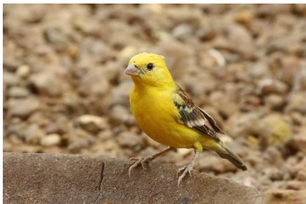
Sudan Golden Sparrow