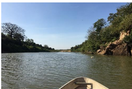
Vi sejler på Gambia-floden