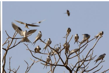
men så var de der, mange af dem!