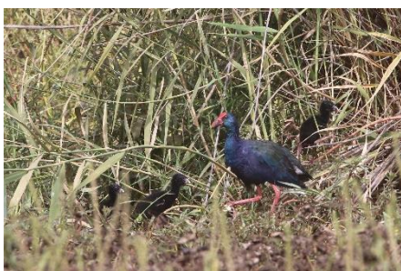
African Swamphen med tre unger