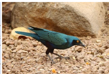
Greater Blue-eared Starling