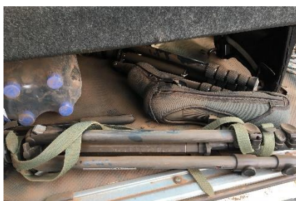
og støvet ...