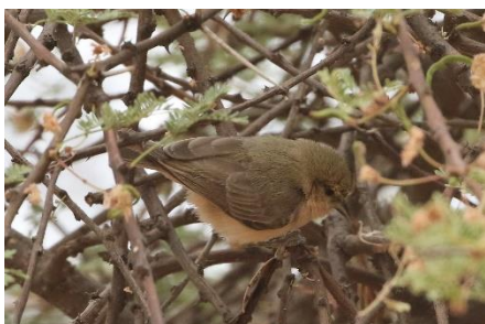
Sennar Penduline Tit