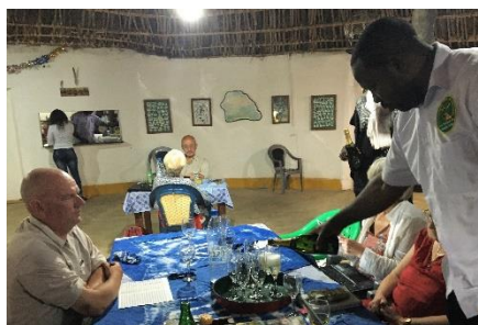
Nytårsaften drikker vi champagne