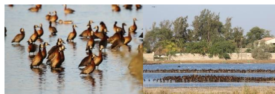
White-faced Whistling Duck. Djoudj Nat. Bird Sanctuary

Sidst på dagen kører vi mod kysten og indlogerer os på vores hotel for 2 nætter, Ranch de Bango.