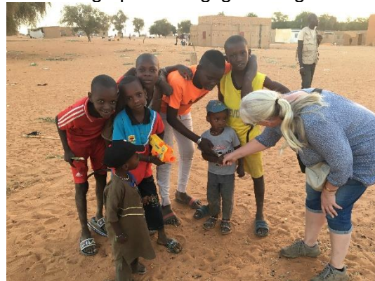
Børnene er altid nysgerrige

Vi anbefaler at pakke kikkert, fotoudstyr, ladere, medicin og andet uundværligt i håndbagagen. Det er som regel bedre beskyttet i håndbagagen og hvis kufferten bliver forsinket, mangler du ikke kikkert mv som du skal bruge hver dag på rejsen. Undervejs er der plads i minibusserne, men vi henstiller til at omfanget af bagage begrænses. Det er en god ide at medbringe en mindre taske til det nødvendige på de daglige udflugter.