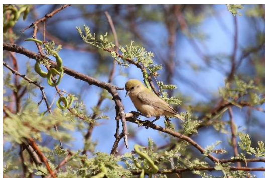
Sennar Penduline Tit

I dag kører vi vestpå til Djoudj National Bird Sanctuary, som er fredet netop for at beskytte det rige fugleliv.