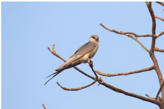
African Scissor-tailed Kite

Dagen slutter på vores hotel for de næste 2 nætter, Keur Saloum i Toubacouta.