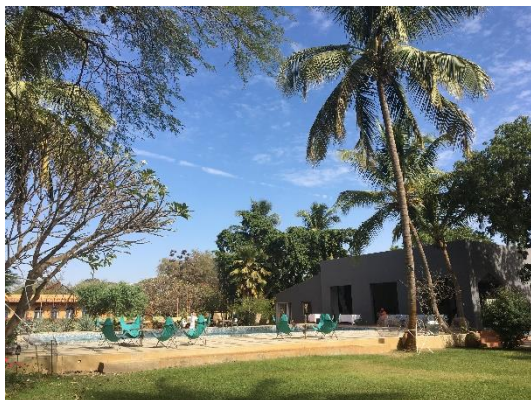
Hotel Ranch de Bango

De fleste hoteller har wifi men forbindelsen kan være langsom og ustabil.