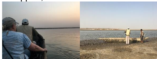
Den korte sejltur i en udhulet træstamme ud til øen, hvor glenterne overnatter, er også en sjov oplevelse.

Efter rejsen laver rejselederen en turrapport, som du får tilsendt.