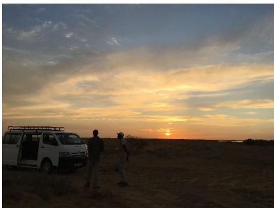
Solnedgang i Djoudj National Bird Sanctuary