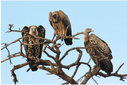
Rüppell's + African White-backed Vulture

Efter morgenmad kører vi ca. 400 km ind i landet til Campement de Wassadou på Gambiaflodens bred. Undervejs har vi tid til at lede efter Quail Plover og andre specialiteter som Sahel Paradise Whydah og White-rumped Seed-eater. Efter ankomst ser vi efter Egyptian Plover hvis lyset tillader det.