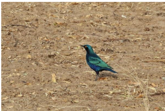
Greater Blue-eared Starling

I dag skal vi køre turens længste stræk op til den nordligste del af Senegal. Vi ser selvfølgelig efter fugle undervejs, mens landskabet bliver mere tørt jo længere nordpå vi kommer. Turen er lang, så der bliver kun korte stop i dagens løb. Hvis tiden tillader det kan vi allerede i aften se efter Golden Nightjar kort før vi er fremme ved vores hotel for de næste 2 nætter, La Cour de Fleuve i Podor.