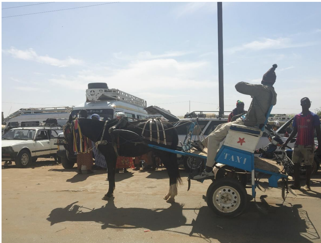
I Senegal mødes nyt og gammelt