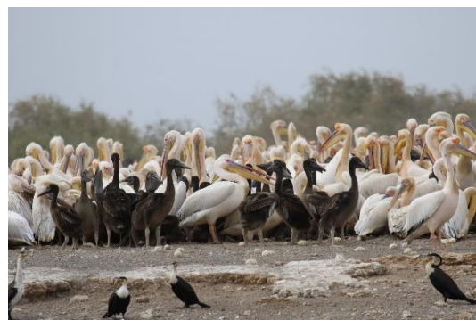
Great White Pelican, White-breasted Cormorant

I formiddag skal vi sejle i Djoudj National Bird Sanctuary. Her er der vand og derfor et andet fugleliv med bl.a. en stor koloni af White Pelican og mange andre vandfugle, som vi sejler ud for at se ganske tæt på. Det er også her vi ser Black Crowned Crane og Sahel-specialiteten River Prinia. Senere kører vi ud i de tørre dele af parken, hvor vi har gode muligheder for at se Arabian Bustard.