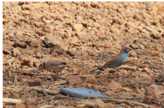
Cut-throat Finch, Red-cheeked Cordon-bleu

Efter morgenmaden kører vi sydpå mod Dakar. Vi har god tid til stop undervejs for at samle op på arter, vi har misset indtil nu, og når spændende fugle krydser vores vej. Især vil vi lede efter Quail Plover hvis vi ikke har set den tidligere på turen. Langs vejen raster ofte mindre flokke af gribbe hvor 6 arter er mulige. Afhængig af hvilken flyrejse man har valgt slutter rejsen i lufthavnen i Dakar eller på et hotel i nærheden for hjemrejse næste dag.