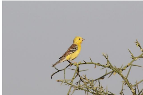
Sudan Golden Sparrow

Det nordligste Senegal er tørt og Senegal-floden, som danner grænsen mod Mauritania er den eneste kilde til vand på denne årstid. Nogle steder er der egentlig skov men de fleste steder er landskabet åbent med spredte træer.