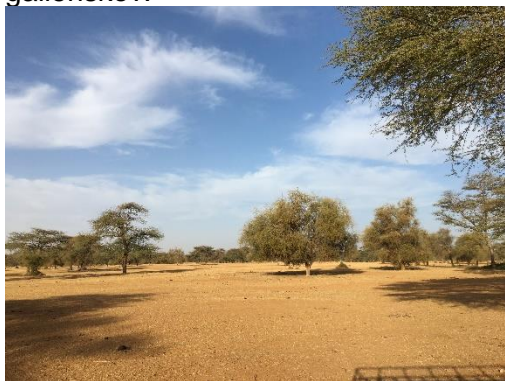
Typisk landskab ved Podor

At rejse i Senegal er en oplevelse i sig selv. Landet er beliggende i overgangszonen mellem Sahara-ørkenen mod nord og regnskovsbæltet mod syd. Det betyder, at vi finder en varieret natur fra den tørre Sahel-region i nord, hvor vand er sparsomt og træerne taber bladene i den tørre tid (vinteren) til de frodige områder ved Saloum- og Gambiafloderne, hvor der vokser stedsegrøn galleriskov.