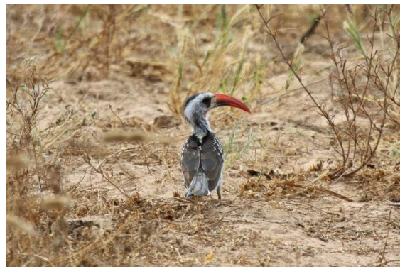
Western Red-billed Hornbill

Efter morgenmaden kører vi sydpå mod Dakar. Vi har god tid til stop undervejs for at samle op på arter, vi har misset indtil nu, og når spændende fugle krydser vores vej. Især vil vi lede efter Quail Plover hvis vi ikke har set den tidligere på turen. Langs vejen raster ofte mindre flokke af gribbe hvor 6 arter er mulige. Afhængig af hvilken flyrejse man har valgt slutter rejsen i lufthavnen i Dakar eller på et hotel i nærheden for hjemrejse næste dag.