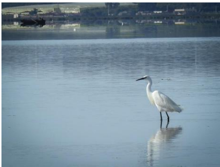
Fler som njuter i solen.

Vi brukar alltid ha en resa till Öland under hösten och så även i år. Denna resa fylldes så snabbt att vi beslutat att genomföra ytterligare en resa till härliga Öland. 24–27 oktober kommer vi att besöka många av de spännande fågellokalerna som finns på södra Öland. Vi kommer att bo bekvämt på Gammalsbygården mitt i världsarvet. Mer information finns på hemsidan, http://fagelguidning.se/oland24-27-oktober-2019-nyinsatt/