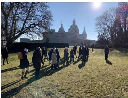
Kalmar bjöd på sol i slottsmiljö!