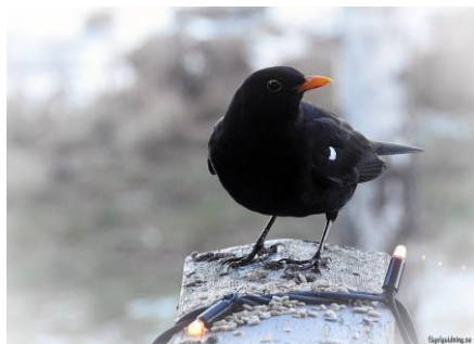
Dot "vår" koltrast snart får vi höra den vackra sången